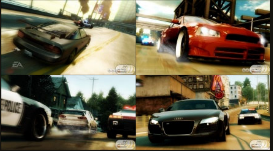
نویسنه شده در Game برچسبها: Need For Speed Undercover

وبنوشت در وردپرس، کام، پوسته: ChaoticSoul کاری از Bryan Veloso.